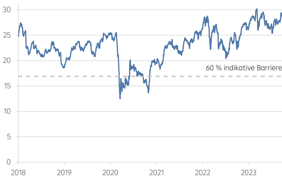
Stand: 29.09.2023 Quelle: Reuters (AXAF.PA), ISIN: FR0000120628 Bitte beachten Sie, dass die Wertentwicklung der Vergangenheit keine Rückschlüsse auf die zukünftige Wertentwicklung zulässt.

AXA SA ist ein in Frankreich ansässiges Versicherungsunternehmen, welches im Bereich der finanziellen Absicherung tätig ist. AXA bietet eine breite Palette von Produkten in verschiedenen Geschäftsbereichen an: Leben & Sparen, Schaden & Unfall, Gesundheit, Vermögensverwaltung und Bankwesen.