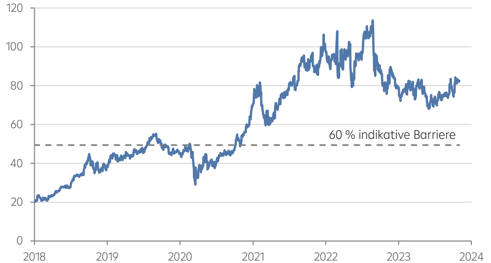
Stand: 01.11.2023 (VER.AV), ISIN: AT0000746409 Bitte beachten Sie, dass die Wertentwicklung der Vergangenheit keine Rückschlüsse auf die zukünftige Wertentwicklung zulässt.