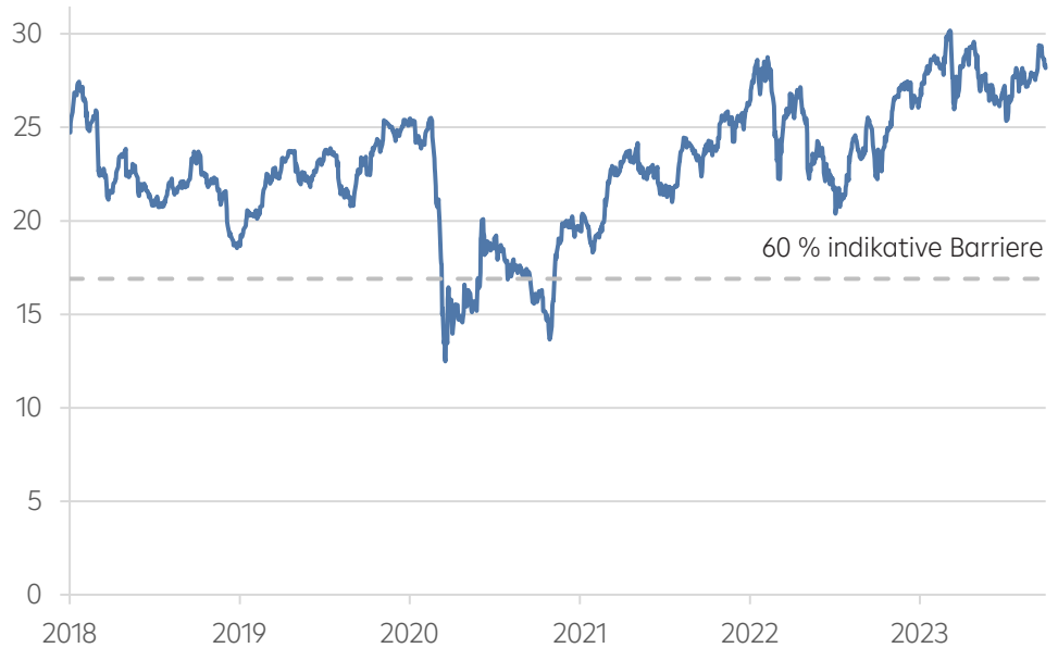
Stand: 29.09.2023 Quelle: Reuters (AXAF.PA), ISIN: FR0000120628 Bitte beachten Sie, dass die Wertentwicklung der Vergangenheit keine Rückschlüsse auf die zukünftige Wertentwicklung zulässt.

AXA SA ist ein in Frankreich ansässiges Versicherungsunternehmen, welches im Bereich der finanziellen Absicherung tätig ist. AXA bietet eine breite Palette von Produkten in verschiedenen Geschäftsbereichen an: Leben & Sparen, Schaden & Unfall, Gesundheit, Vermögensverwaltung und Bankwesen.